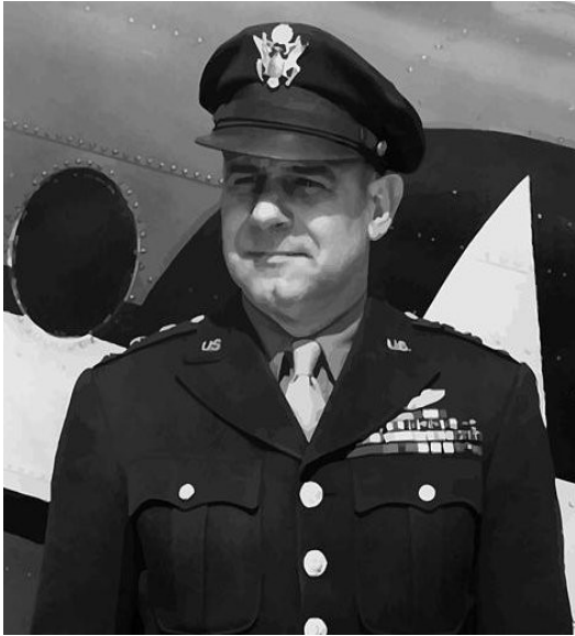
Generale Jimmy Doolittle