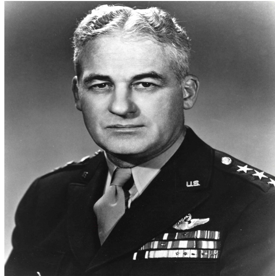
Generale Nathan Twining