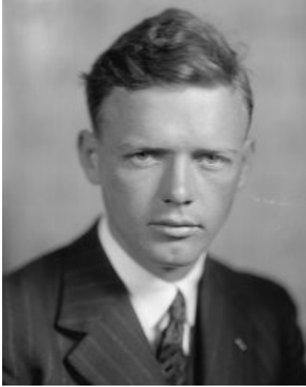
Charles Augustus Lindbergh ( Detroit, 4 febbraio 1902 – Maui, 26 agosto 1974 ) Era l'eroico trasvolatore dell'Atlantico, a quanto pare anche lui presente a Roswell dopo l'incidente.